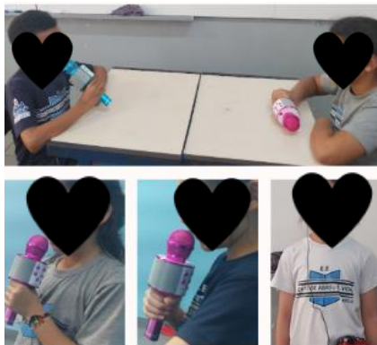
Imagem 2 - Podcasts com os alunos.

Durante o trabalho, a professora desenvolveu as seguintes atividades com a turma: estudo das características e da estrutura do gênero Podcast ; leitura de roteiros pelas crianças utilizando o microfone e headphones; entrevistas em duplas; as crianças participaram de Podcasts respondendo perguntas dos colegas de sala. Em seguida, elaboraram oralmente os roteiros; escreveram as perguntas e revisaram de forma coletiva; elaboraram com apoio da professora a escrita final dos enunciados para os convidados dos Podcasts .