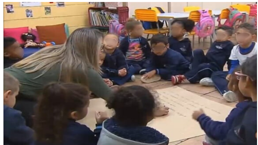
Imagem 2 – O registro

Cada criança contribuiu com ideias criativas, personagens encantadores, falas divertidas e cenários surpreendentes.