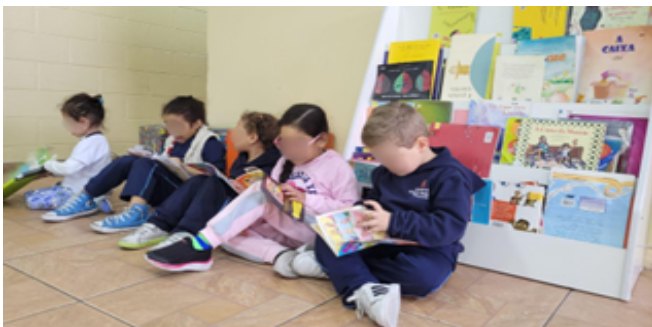
Imagem 1 – Sala de leitura

Em nosso cotidiano, é comum que façamos um momento de contação de história, podendo ser na sala de referência, sala de leitura ou em qualquer lugar para o qual levamos ou nos encontramos com um livro. Durante a leitura de um livro, algumas crianças demonstram curiosidade pelas imagens e pelo enredo, mas há as que não se interessam, buscando outros livros ou brinquedos.