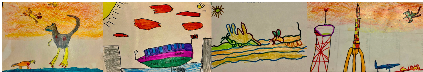
Criação de Pedro de Mello Campos aos 5 anos de idade (São Carlos, década de 1990).