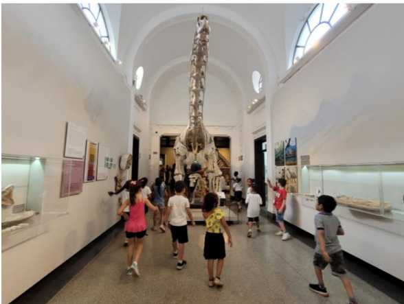
Imagens 6 e 7 – Visita ao museu.

Durante a visita ao Museu de Zoologia, os registros continuaram — elas queriam reler placas que já haviam visto na visita online. “Quando vamos chegar naquela cabeça de T-rex?” , “Prô, lê essa placa que fala do carnotauro de novo?” , “Olha, esse aqui está em outro lugar agora!” .