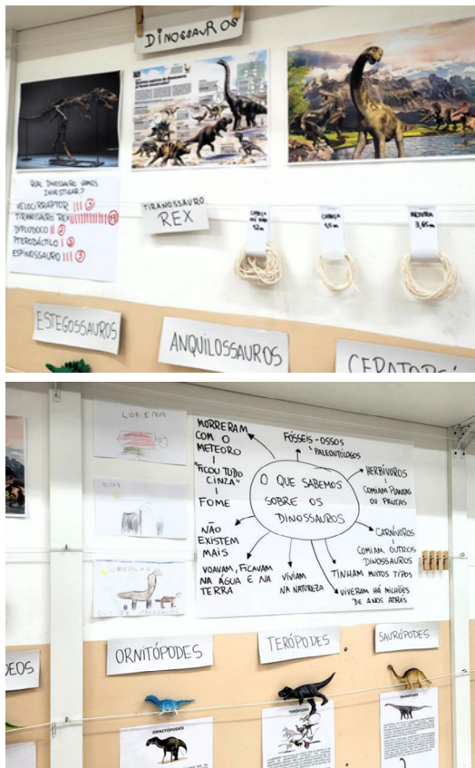
Imagens 1, 2, 3 – Materiais de pesquisa

A curiosidade cresceu e abriu caminho para o planejamento coletivo, em que reunimos materiais como livros, revistas, textos científicos flexibilizados, vídeos, brinquedos. A partir desses materiais, levantamos hipóteses e organizamos perguntas para guiar a pesquisa do grupo. As crianças foram protagonistas de todo o processo, e a professora atuou como mediadora entre uma descoberta e outra.